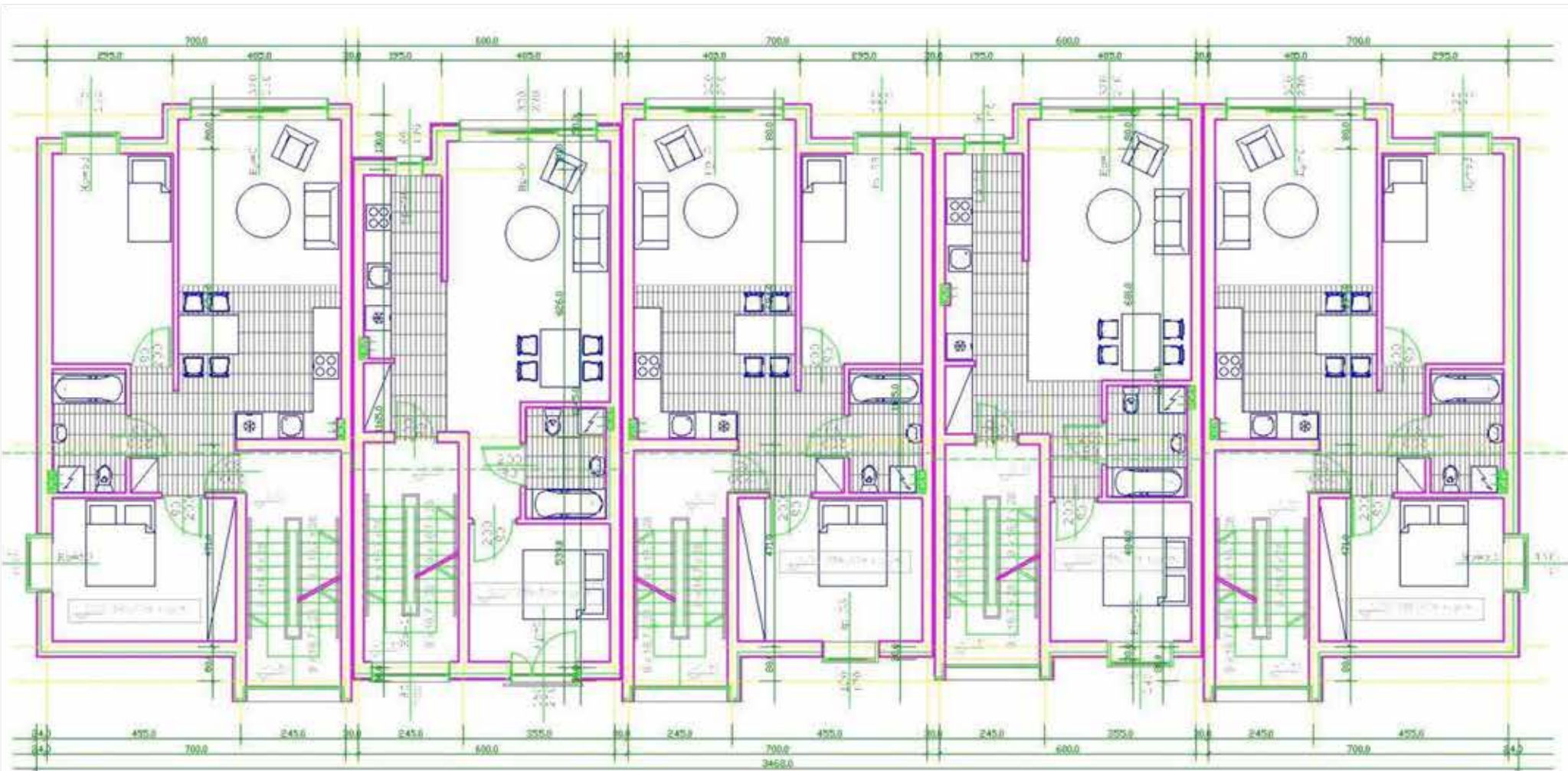
MIESZKANIE NR 1